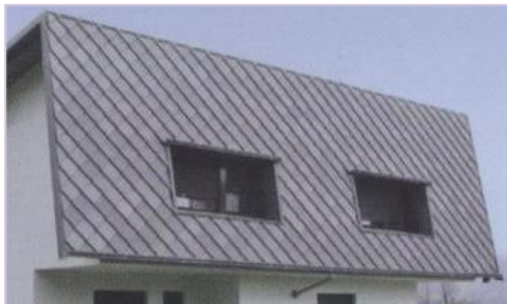
Tetto in zinco titanio