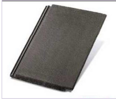
Esempio di simil lose in cemento (tipo "Tegal")

In ogni caso l'intervento sul materiale di copertura dovrà essere sottoposto al parere delle Commissione Igienico Edilizia che ne valuterà la compatibilità edilizio-architettonica rispetto al contesto edificato.