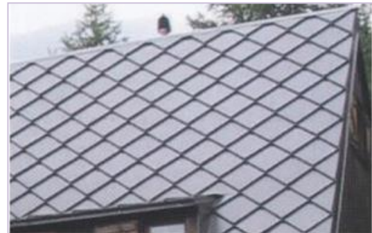
Tetto in alluminio preverniciato

Esempio di simil lose in metallo (tipo "Alp Rocciavrè", progetto scandole)